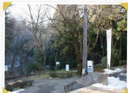
▲城山へ左に行くと行き止まり