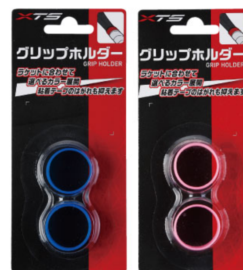
グリップホルダー